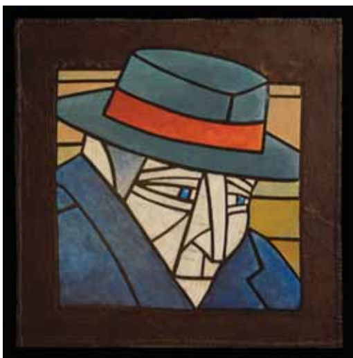
François Bienvenue, TITRE , 2012. Bois découpé,???? © François Bienvenue

Le dessin de François Bienvenue illustre l'état d'âme de chaque personnage. Il transmet une émotion, un vécu, une histoire. Cet ensemble placé en l'Espace invitation a un effet émouvant. Du point de vue formel, ces œuvres font corps par la répétition de la forme carrée tandis que du point de vue subjectif, elles le font par la cohérence du traitement. Voilà un moment fort d'émotion. Un moment de silence et de réflexion.