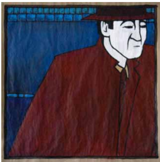
François Bienvenue, Absence en passant , 2012. Acrylique sur papier, 81 x 81 cm © François Bienvenue

Dans tous les cas de figures, le regard du personnage est tourné vers l'intérieur. Tout se passe comme si c'était des personnages absents comme dans Absence en passant et Ceux-là aussi . Le dessin toujours épuré se forme de ligne directe, précise et vivante. Un rapport d'équilibre entre les lignes s'installe. La facture est toujours texturée et expressionniste.